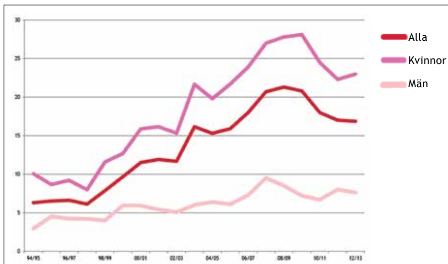
Figur 3. Andel i procent av antalet avgångna elever på programmet som påbörjat högskolestudier inom tre år från 1994/95-2012/13, fördelat på kvinnor, män och totalt.