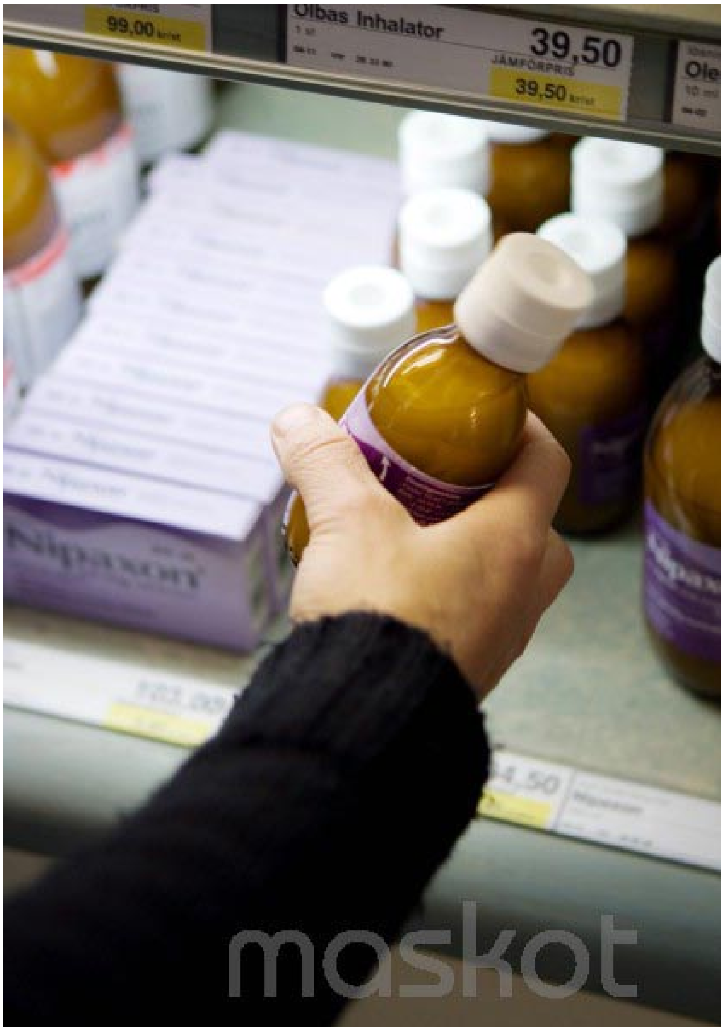
Dyslexi kan ställa till problem men det är ingen sjukdom