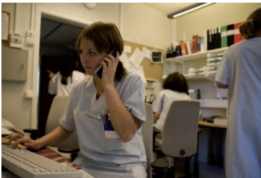
Du som arbetskamrat kan hjälpa till