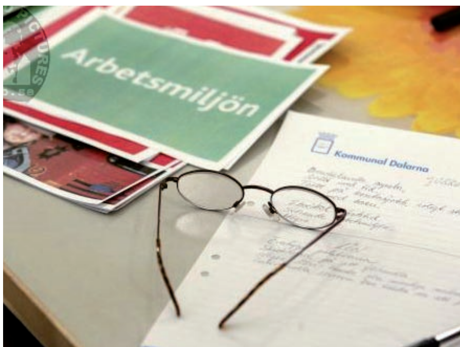
Dyslexi har inget med intelligens att göra

Dyslexi innebär också att det kan ta längre tid att gå från tanke till handling, till exempel när man ska svara på frågor från arbetskamrater eller besvara skriftliga uppgifter. Men återigen – problemen har inget med intelligens att göra. Och i praktiken har många tränat upp sin minnesförmåga mycket bra. Det andra har samlat i pärmar och mappar på datorn, har en person med dyslexi ofta i minnet. Dessutom brukar man ha ett gott bildminne och en bra förmåga att förstå och översätta bilder och även allmänt en stor kreativitet.