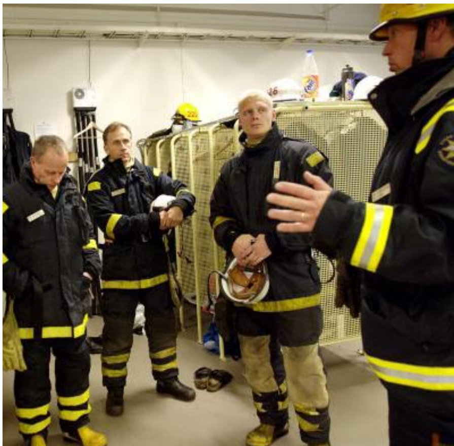
Har alla förtroendevalda fått utbildning om dyslexi?

Var noga med att skicka ut skriftlig information i förväg och se till att det finns en tydlig dagordning för mötet. Om man måste läsa igenom en skriftlig information under mötet, ge då först en muntlig sammanfattning och ge sedan rejält med lästid till mötesdeltagarna.