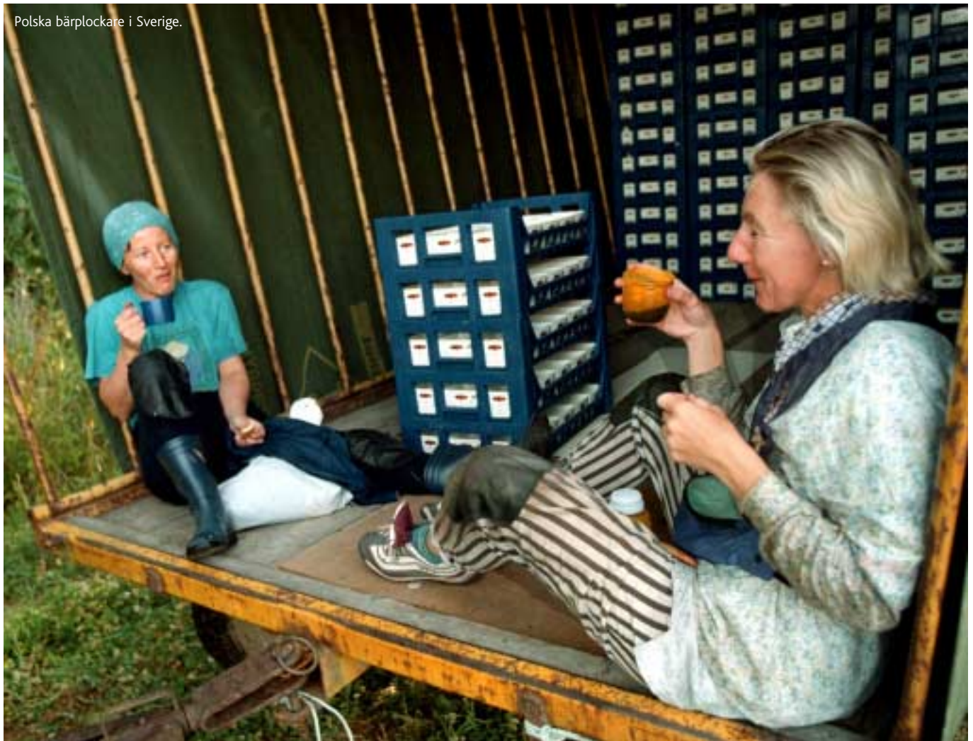
Polska bärplockare i Sverige.