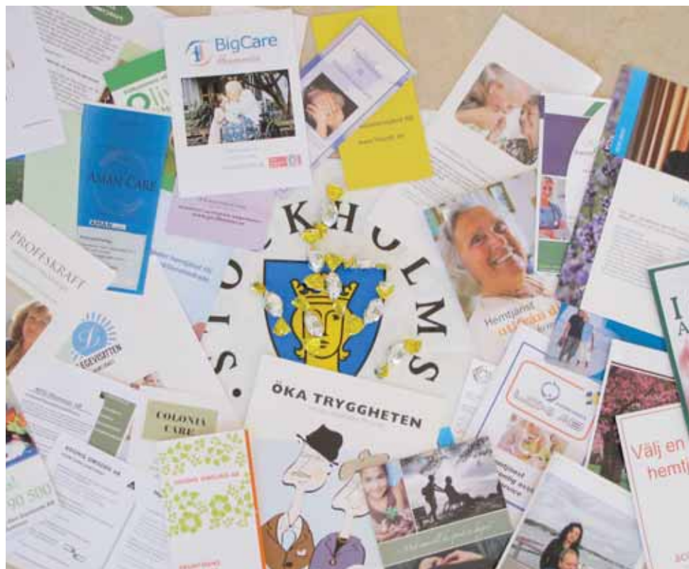
Ett litet urval av alla broschyrer på mässan om att välja hemtjänst.