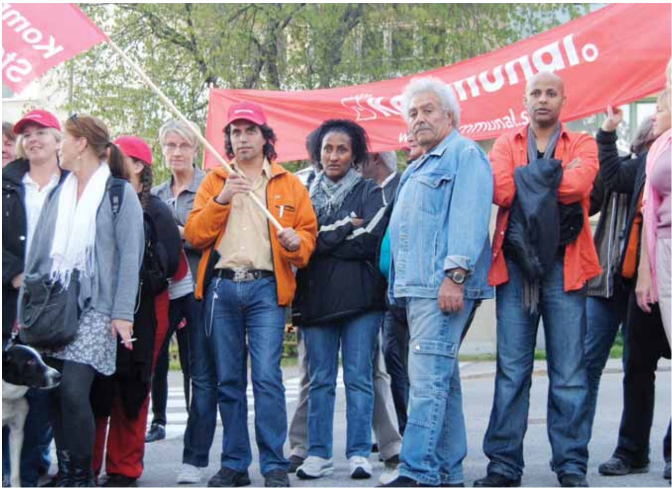
Många fler borde sluta upp och säga ifrån, sparkravet motsvarar 100 tjänster.